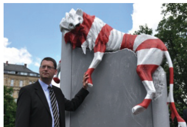
Thorsten Schäfer-Gümbel (SPD-Landesvorsitzender)

„Wir wollen damit die abstrakte Finanzdiskussion anschaulich machen, denn die Leidtragenden der geplanten Kürzungen werden ganz unmittelbar die Bürgerinnen und Bürger sein. Die Kür-