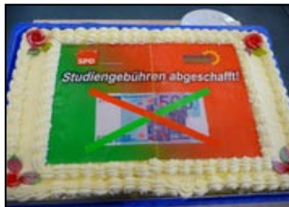
Rot-Grüne Torte zur Abschaffung der Studiengebühren

es, Änderungen anzusetzen, die den ungesunden Druck von den Schülerinnen und Schülern nehmen. Die ist natürlich auch nur mit einer konsequenten Ausweitung von Ganztagschulen möglich. Gerade hier hat die letzte Regierung von Roland Koch die Entwicklung verschlafen und Hessen auf einen unteren Rang in Deutschland geführt.